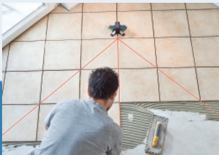
Angle- 45° & 90° Instalar en ángulo