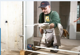
Plumb/ Align Aplomar/ Alinear