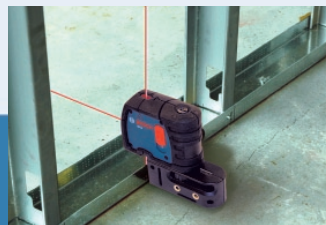
Magnetic Attachment Aditamento magnético